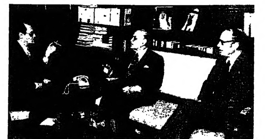
السفير الشاعر يتحدث الى الرئيس سلام والسفير باركر

زار الرئيس صليب سلام قبل ظهر امس السفير السعودي القوي اول على السفير في السفارة، وادخل به لساعة كاملة. وصانف وصوله وجود السفير اليماني السيد رشاد باركر مجتمعا مع السفير الشاعر، ونحضر سلام جلوسا مع السفير. وقال سلام بعد الاجتماع: انها زيارة للصدق والسلم الترقى اول على الشاعر، والسلم عليه بعد مودته من رحلته، وبنه تيناتي خاصة بعد الاضيء المبارك الذي يتينا في هذه الظروف الحرجة، وليس المجال مجال مفاوضات سيدة كالتامة. واضاف: وكانت مناسبة لتبني في الشؤون اللبنانية التي يوليها السفير دائما اهتمامه الكلي والشؤون العربية التي نتمنا جميعا.